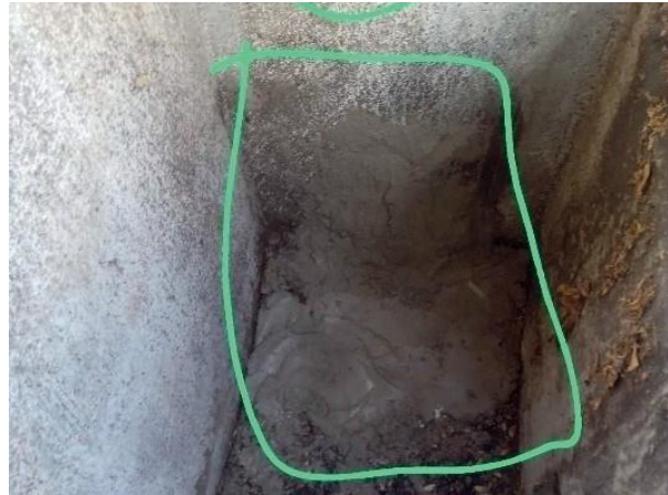
Figura 57: Caixa da galeria recuperada.