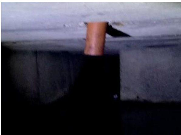
Figura 44: Tubulação encontrada, mas sem contribuição.

No relatório é destacado uma contribuição da boca de lobo do sistema de drenagem.