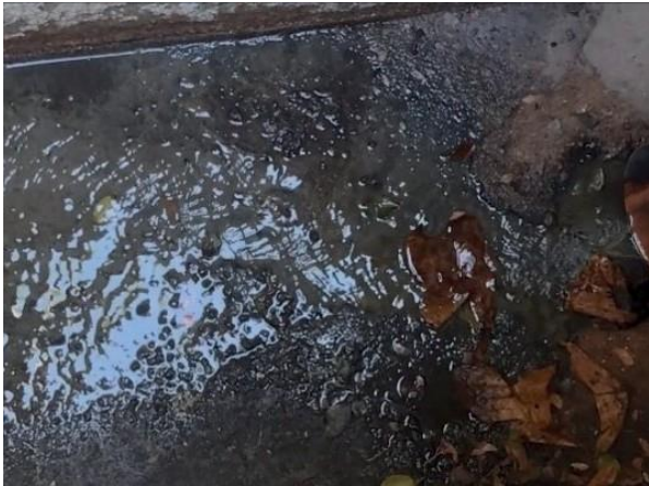
Figura 55: Foto 17 replicada do relatório técnico da Seuma.