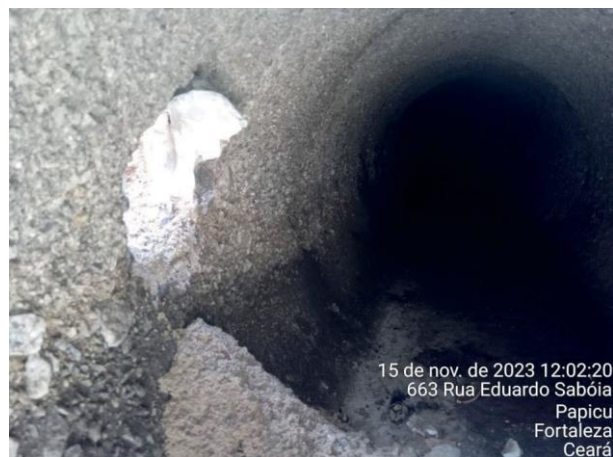
Figura 68: Vista da galeria sem a tubulação.