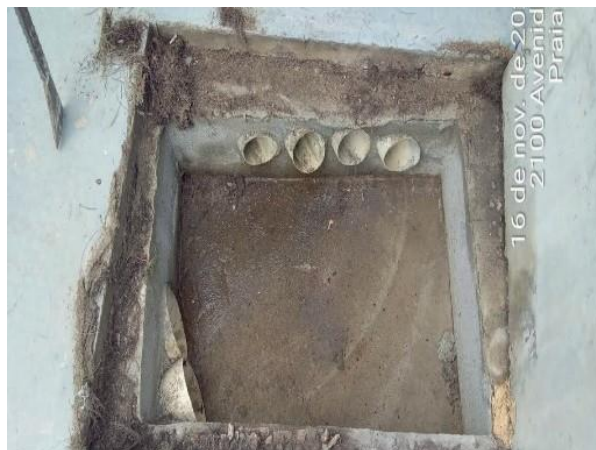
Figura 36: Uma das caixas encontradas sem contribuição de esgoto.