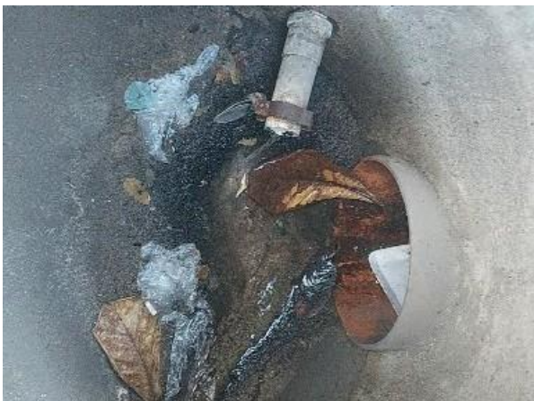
Figura 72: Caixa de contribuição de águas pluviais, não se trata de ligação de esgoto.

No relatório é apresentado uma tubulação com contribuição, mas não é visível a destinação para a rede de drenagem.