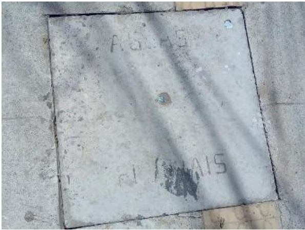
Figura 39: Tampa de águas pluviais encontrada.

No relatório é apresentado um poço de visita com a descrição de lançamento de esgoto, mas não apresenta nenhuma intervenção na galeria e nem lançamento visível.