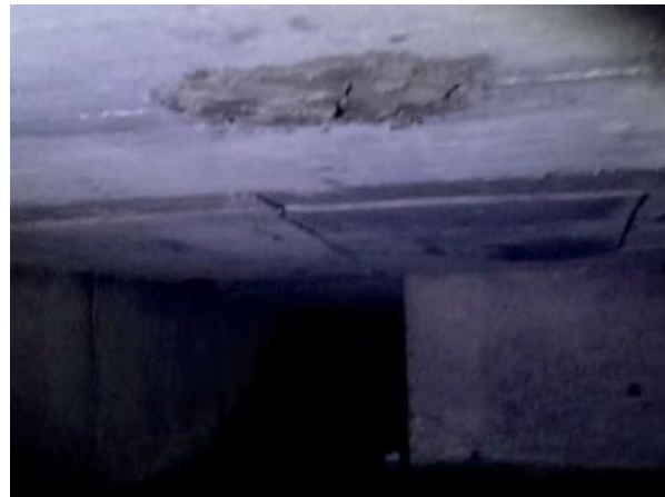
Figura 45: Tubulação retirada e realizado a recuperação da laje.