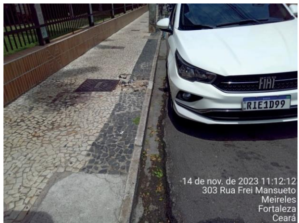
Figura 49: Caixa sem extravasamento.