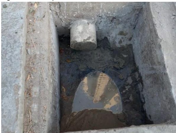
Figura 16: Ligação antiga do imóvel tamponada.