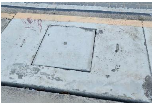
Figura 37: Equipe verificando interligação das caixas de inspeções de contribuição pluvial.