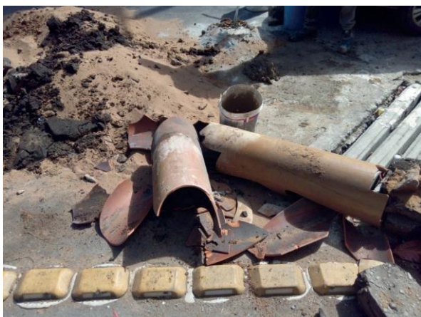
Figura 11: Tubulação retirada.