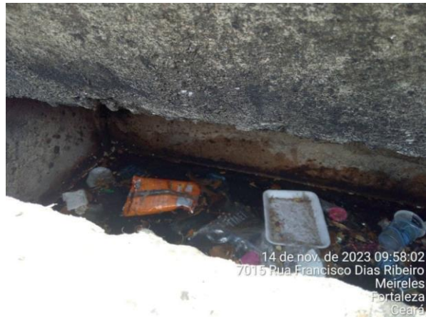
Figura 31: Situação encontrada.