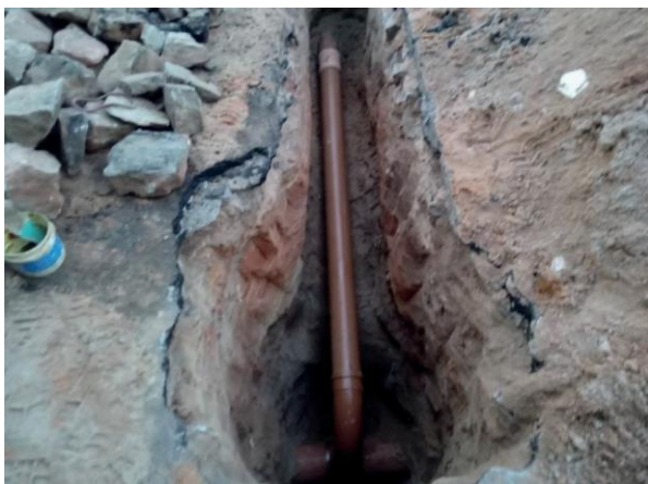
Figura 69: Ligação nova executada.