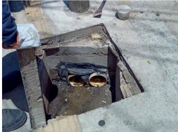
Figura 40: Tubulação branca interligada ao poço da drenagem.