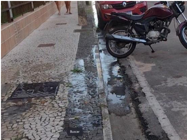
Figura 48: Foto 15 replicada do relatório técnico da Seuma.