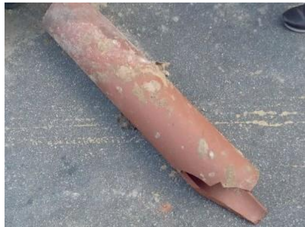
Figura 19: Tubulação retirada.