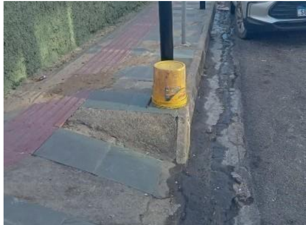
Figura 52: Água servida encontrada na sarjeta.