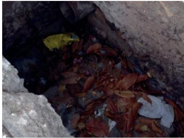
Figura 60: Caixa de drenagem sem lançamento de esgoto, verificado e trata-se de água de piscina.