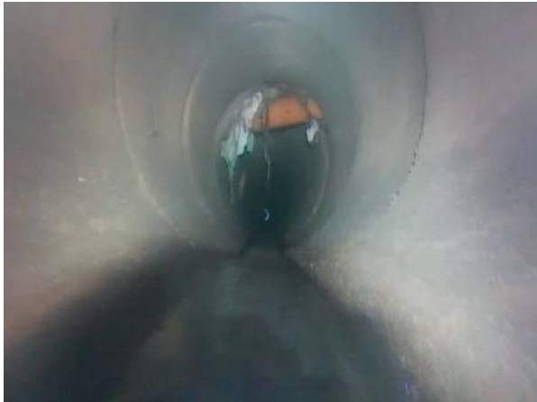
Figura 26: Foto 07 replicada do relatório técnico da Seuma.