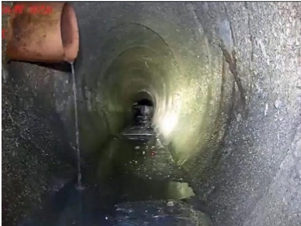
Figura 66: Foto 21 replicada do relatório técnico da Seuma.