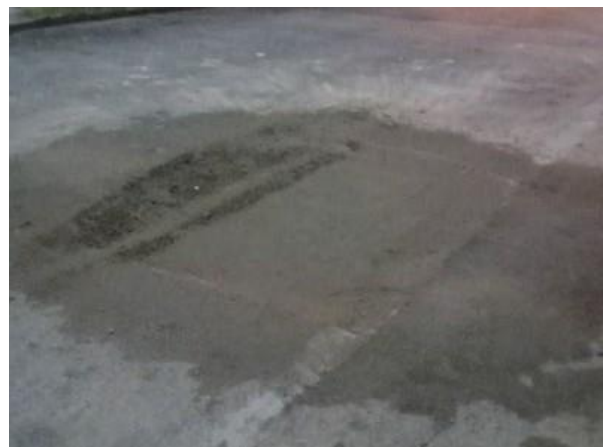
Figura 21: Via recuperada.