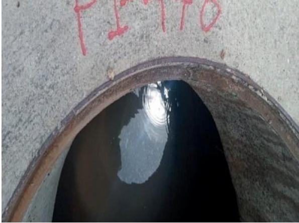
Figura 38: Foto 11 replicada do relatório técnico da Seuma.