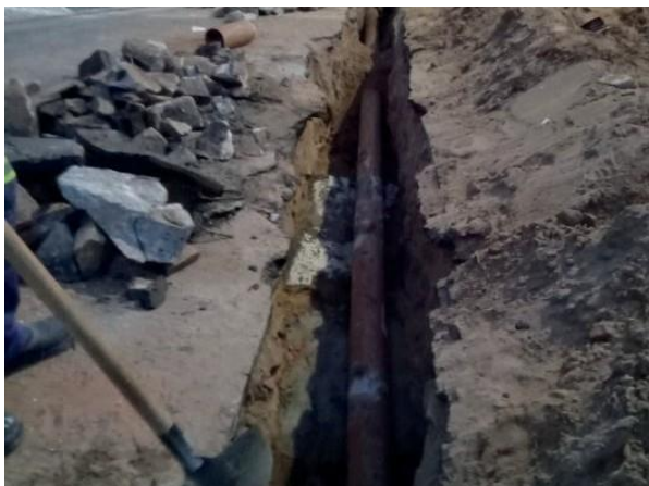
Figura 27: Rede de esgoto remanejada e retirada da interferência com a galeria.

Encontrada tubulação com interferência na geratriz superior da galeria, sem contribuição de esgoto.