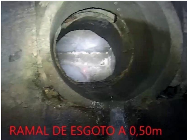
Figura 22: Foto 06 replicada do relatório técnico da Seuma.

Evidência Relatório Seuma: Destacada uma contribuição para a rede de drenagem.