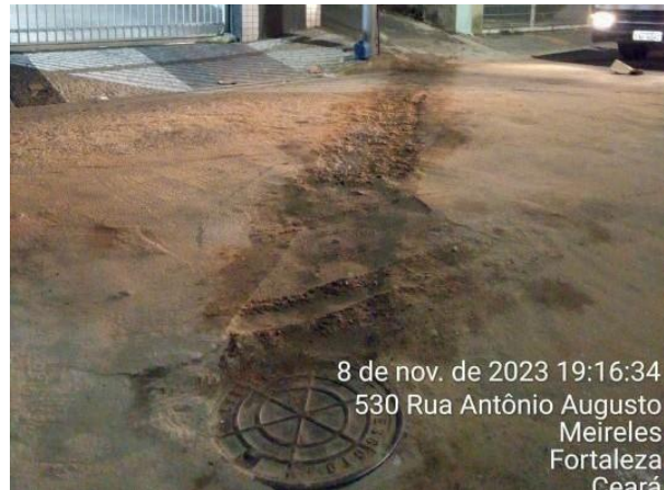
Figura 28: Serviço concluído.