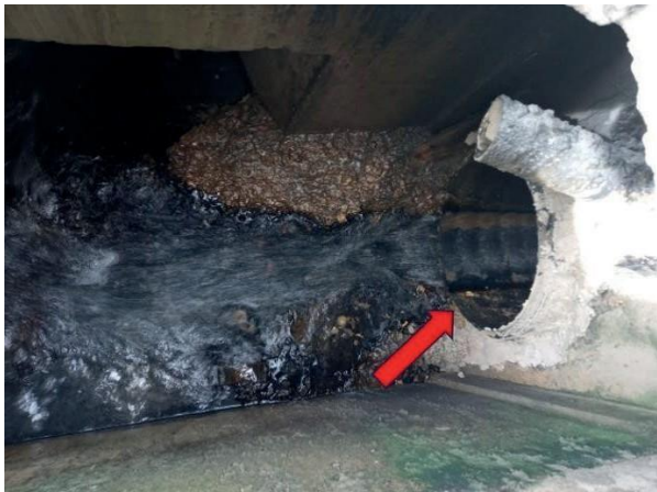
Figura 34: Foto 10 replicada do relatório técnico da Seuma.