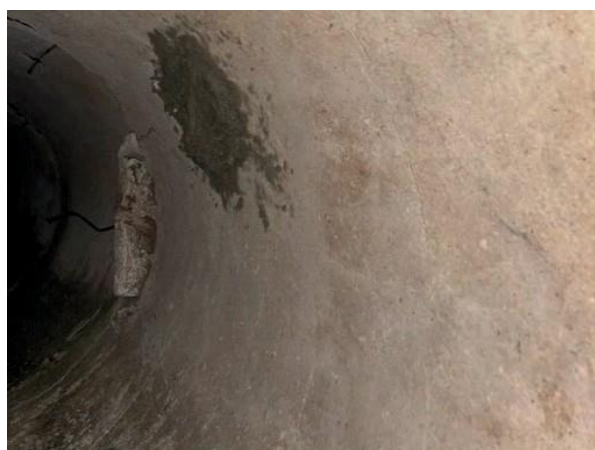
Figura 05: Tubulação retirada e parede da galeria recuperada.

Encontrada tubulação interligada à galeria.