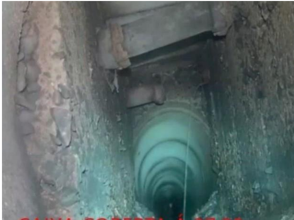
Figura 13: Foto 04 replicada do relatório técnico da Seuma.

Evidência Relatório Seuma: Encontradas duas tubulações interligadas à galeria.