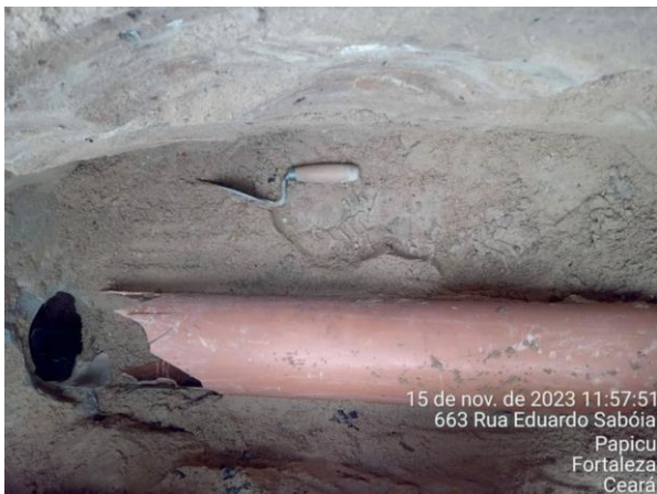
Figura 67: Tubulação retirada.

No relatório é apresentado uma tubulação interligada à galeria.