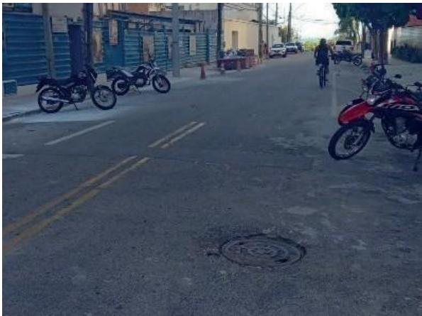
Figura 51: Rede coletora de esgoto sem extravasamento.

No relatório é apresentado um extravasamento em via pública em direção a boca de lobo, mas pelo próprio registro fotográfico não é possível visualizar tal lançamento.