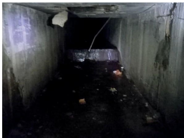
Figura 07: Foi retirado a tubulação e recuperada a parede da galeria.

Encontrada tubulação interligada à galeria.