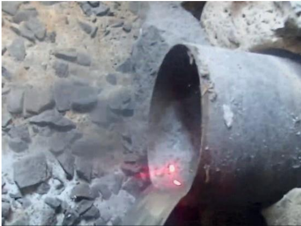
Figura 58: Foto 18 replicada do relatório técnico da Seuma.