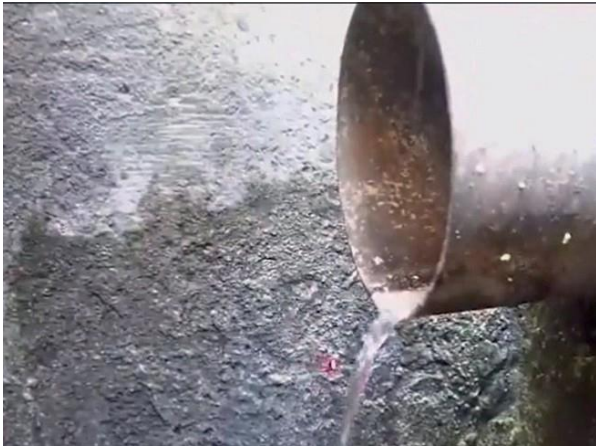
Figura 61: Foto 19 replicada do relatório técnico da Seuma.