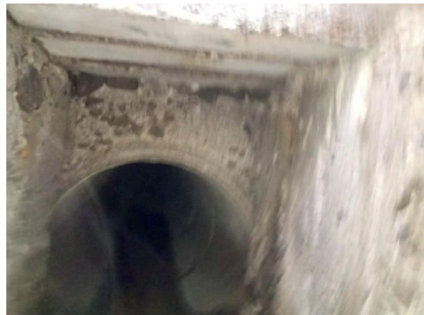
Figura 15: Registro da galeria após a retirada das tubulações.