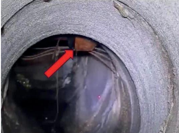
Figura 64: Foto 20 replicada do relatório técnico da Seuma.