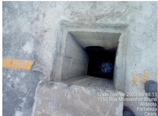
Figura 24: Caixa interligada a rede de drenagem encontrada.