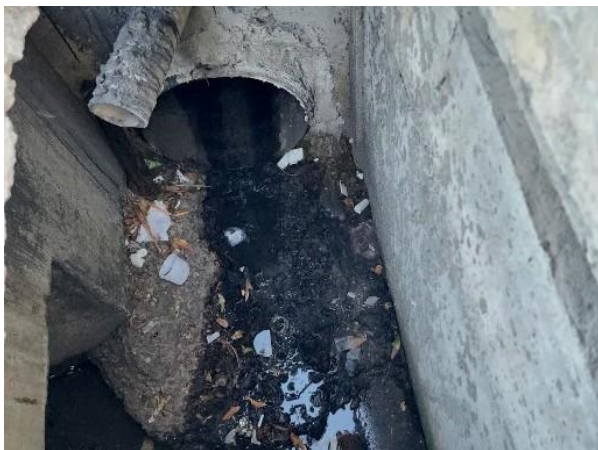
Figura 35: Foi vistoriado e não encontrado contribuição de esgoto, mas caixa de águas pluviais interligadas.

No relatório é destacado uma contribuição na boca de lobo do sistema de drenagem.