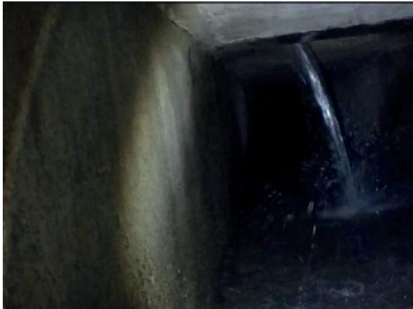
Figura 43: Foto 13 replicada do relatório técnico da Seuma.