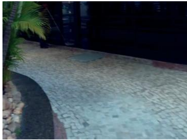
Figura 63: Tubulação do referido imóvel.