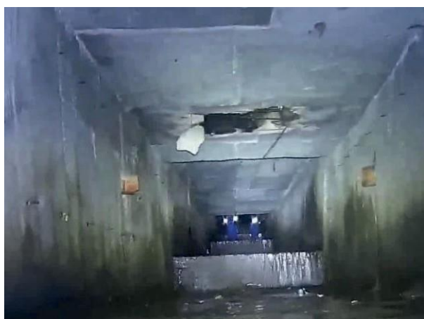
Figura 06: Foto 02 replicada do relatório técnico da Seuma.