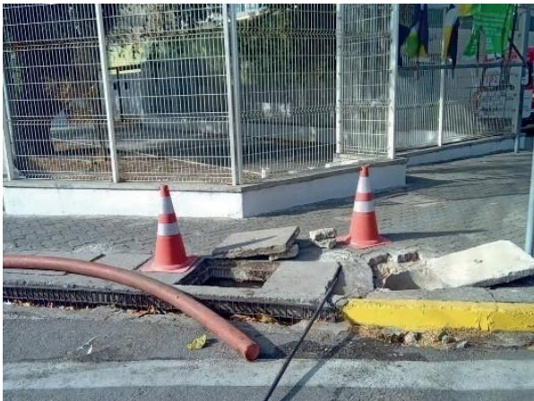
Figura 56: Serviço de retirada do tubo em andamento.

No relatório é apresentado uma tubulação interligada à galeria.