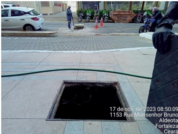
Figura 23: Equipe em campo realizando a vistoria.

Evidência Relatório Seuma: Destacada uma contribuição para a rede de drenagem.