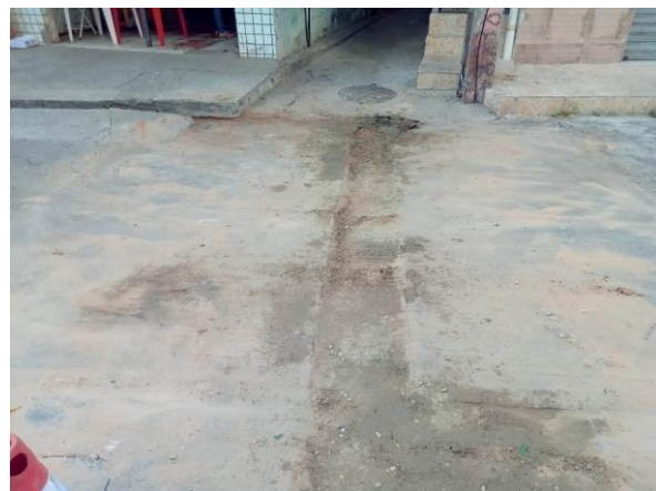
Figura 70: Recuperação em andamento.