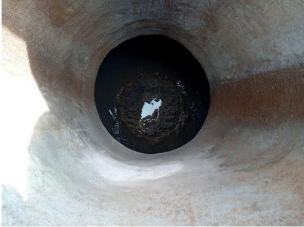
Figura 32: Foto 09 replicada do relatório técnico da Seuma.