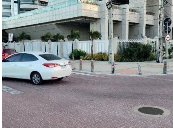
Figura 33: Poço de visita de drenagem localizado e vistoriado.

No relatório é apresentado um poço de visita com efluente.