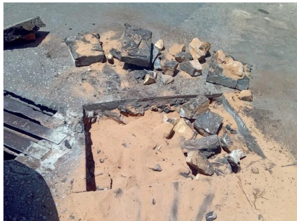
Figura 10: Retirada da tubulação em andamento.