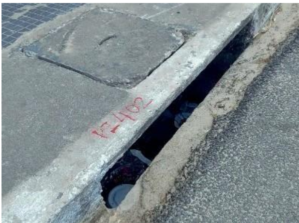
Figura 30: Boca de lobo referenciada no relatório da Seuma.

Evidência Relatório Seuma: Destacado uma contribuição para a rede de drenagem.