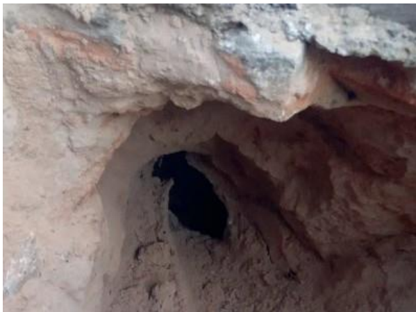
Figura 18: Parede da galeria sem a tubulação.