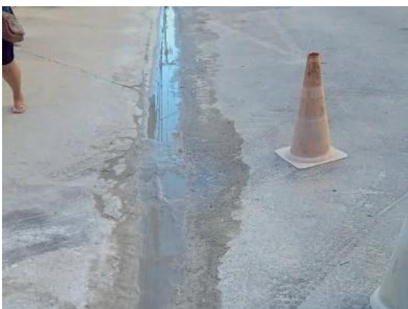
Figura 53: Encontrado o ponto do lançamento, trata-se de água servida de uma obra.