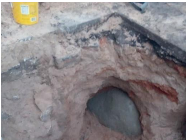
Figura 20: Chumbamento da parede da galeria realizada.