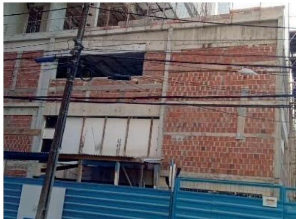
Figura 54: Local do lançamento de água servida na sarjeta.