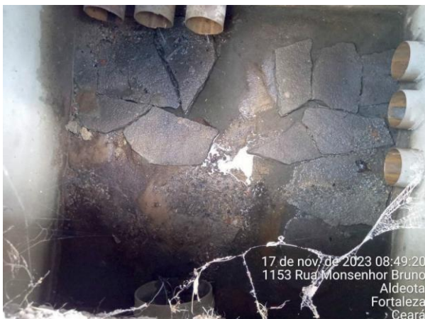
Figura 25: Caixa de inspeção do hotel com a contribuição de águas pluviais.