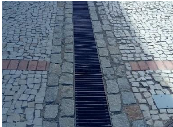
Figura 73: Canaletas coletora de águas pluviais.