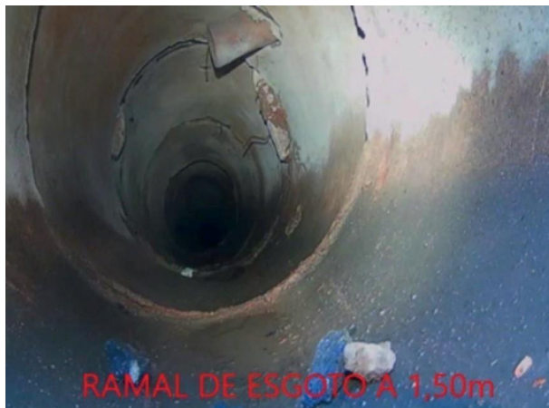
Figura 04: Foto 01 replicada do relatório técnico da Seuma.