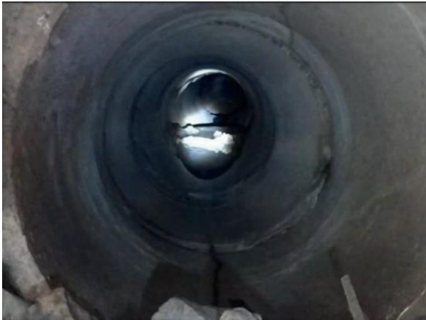
Figura 46: Foto 14 replicada do relatório técnico da Seuma.