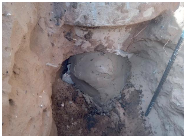
Figura 12: Chumbamento realizado.