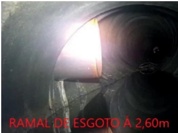
Figura 08: Foto 03 replicada do relatório técnico da Seuma.