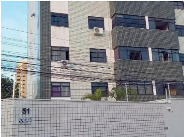
Figura 59: Imóvel verificado com o devido lançamento de água de piscina na galeria.

No relatório é apresentado uma tubulação interligada à galeria com contribuição.