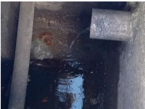
Figura 62: Caixa encontrada e realizada a vistoria, lançamento de água do ar condicionado.

No relatório é apresentado uma tubulação clandestina interligada à galeria com contribuição.