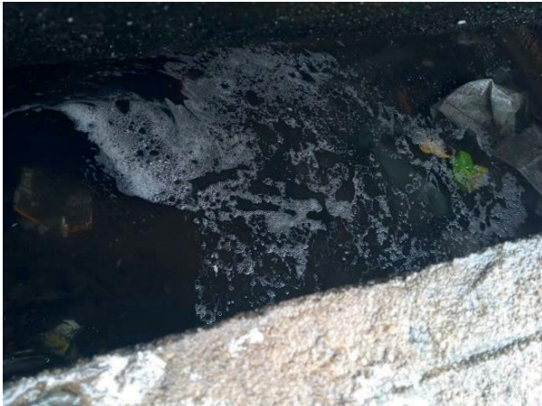
Figura 29: Foto 08 replicada do relatório técnico da Seuma.

Evidência Relatório Seuma: Destacado uma contribuição para a rede de drenagem.