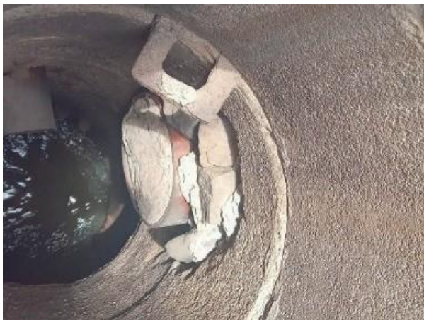
Figura 09: Tubulação já isolada tempos atrás.

Encontrada tubulação interligada à galeria.