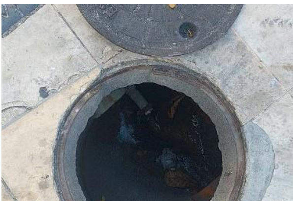
Figura 74: Tampa com identificação de rede de esgoto, não é padrão Cagece e a mesma trata-se de águas pluviais.