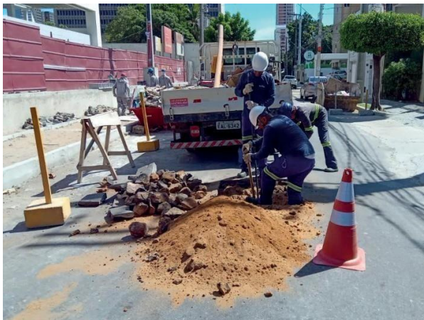
Figura 14: Serviço em andamento.

Evidência Relatório Seuma: Encontradas duas tubulações interligadas à galeria.