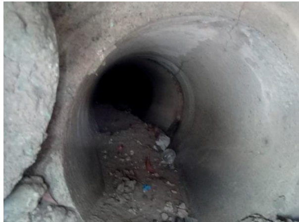
Figura 47: Não identificado nenhum lançamento.