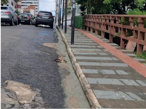
Figura 50: Foto 16 replicada do relatório técnico da Seuma.