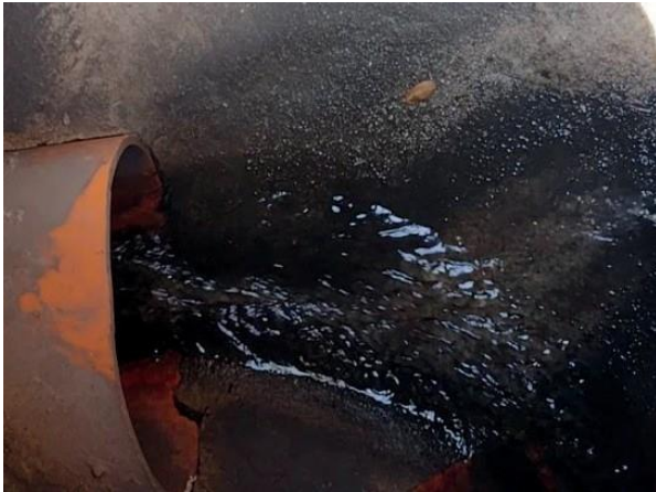
Figura 71: Foto 22 replicada do relatório técnico da Seuma.