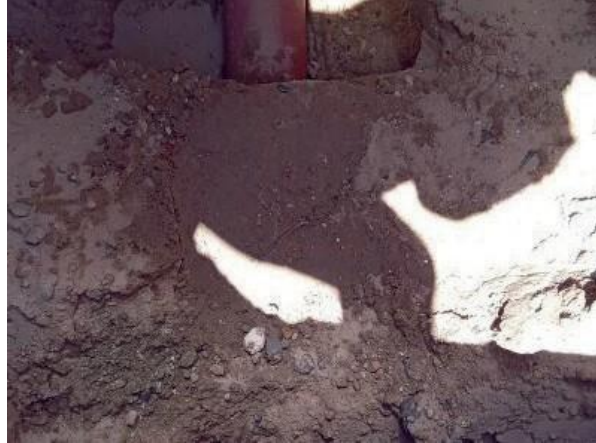
Figura 65: Tubulação passando na geratriz superior, foi encamisada para evitar contribuição, pois não tinha cota para remanejamento.