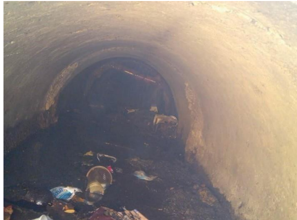
Figura 42: Identificação da rede de abastecimento de água, programado o remanejamento da mesma.

Encontrado tubulação com interferência na geratriz superior da galeria, sem contribuição.