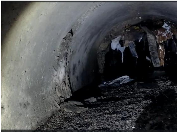
Figura 41: Foto 12 replicada do relatório técnico da Seuma.